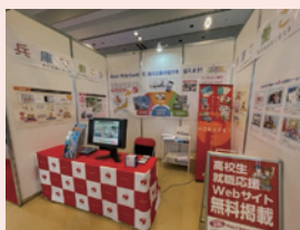
当社イベント用ブース